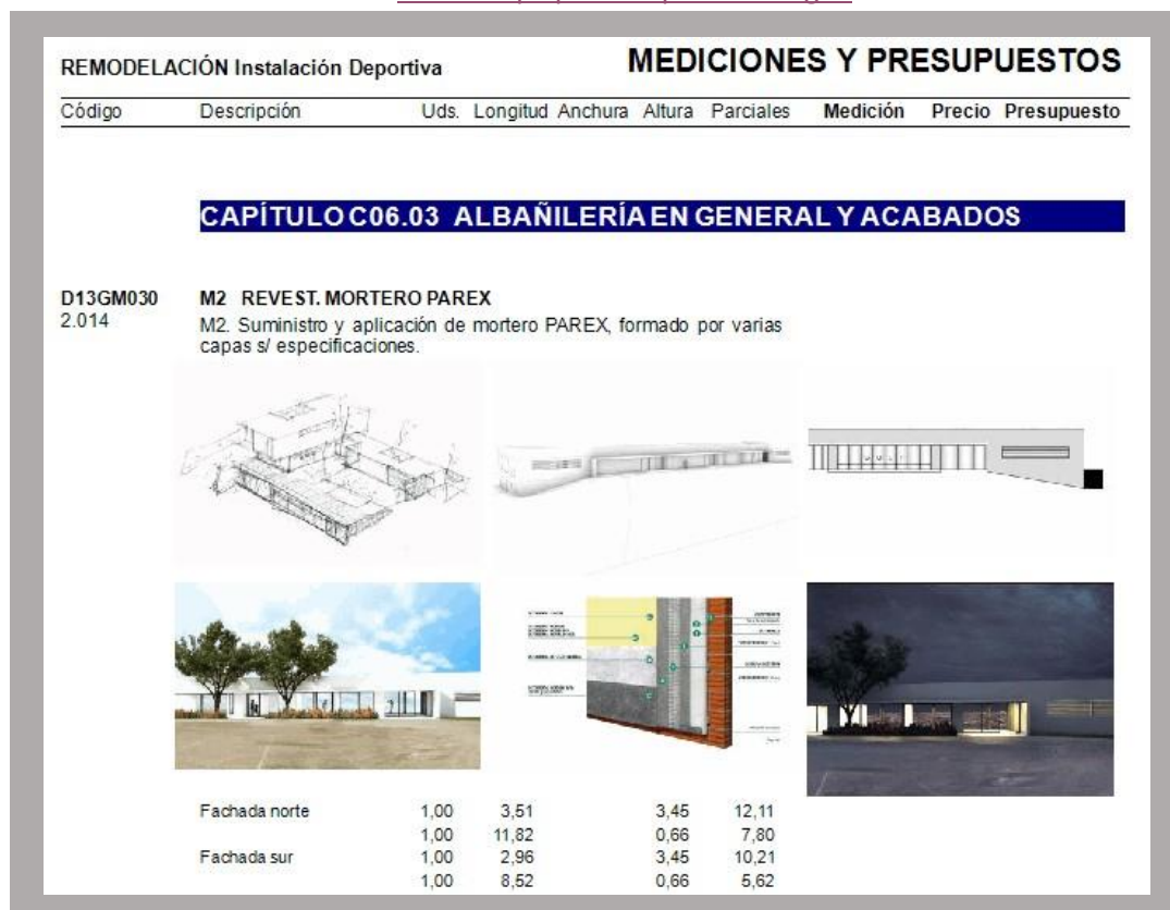
IMAGEN 1 (hojas del presupuesto)

Hoja del presupuesto del proyecto inicial al cual se le ha añadido a una partida imágenes aclaratorias y definitivas.