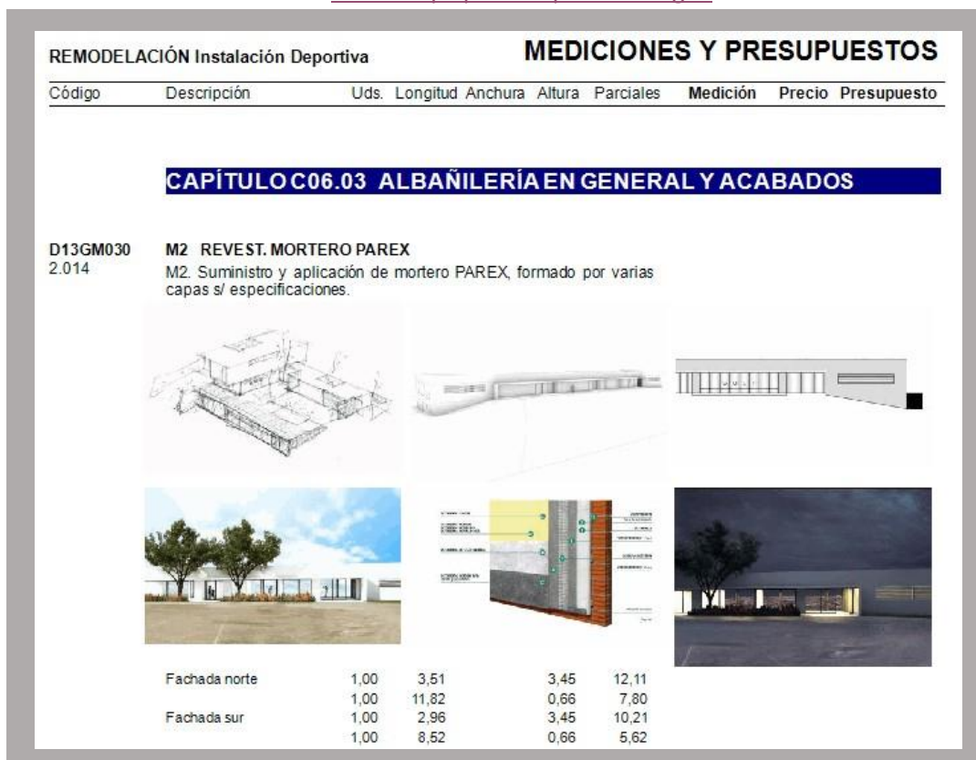
IMAGEN 1 (hojas del presupuesto)

Hoja del presupuesto del proyecto inicial al cual se le ha añadido a una partida imágenes aclaratorias y definitivas.